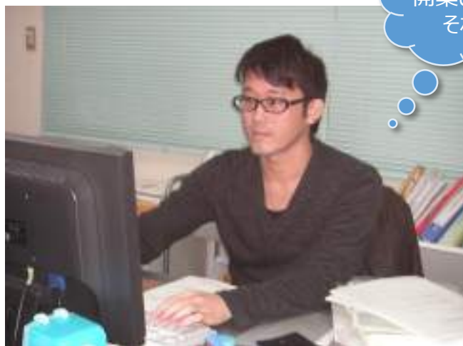
平野・寶意司法書士・行政書士事務所

私たちが、「パネルディスカッション形式」で独立開業のポイントをお話しさせていただきます