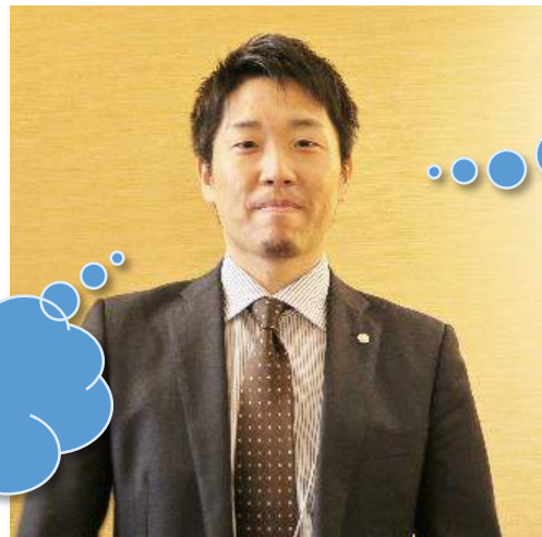
高山・高月司法書士事務所