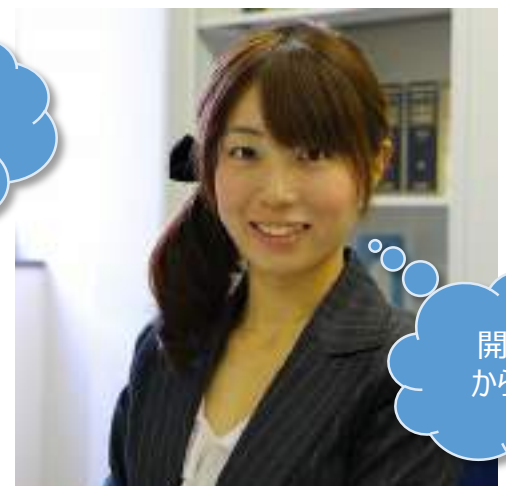
みさき司法書士事務所